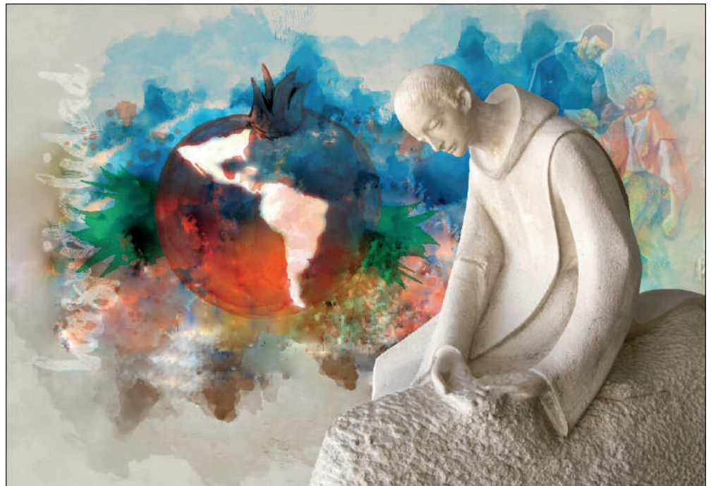
Escultura de San Juan de Dios

Visualizando la tarea que nos ha encomendado el Capítulo Regional la Comisión delegada cree conveniente dividir el trabajo en dos fases.